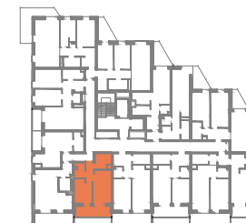
UL. GEN. MADALIŃSKIEGO