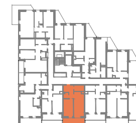
UL. GEN. MADALIŃSKIEGO